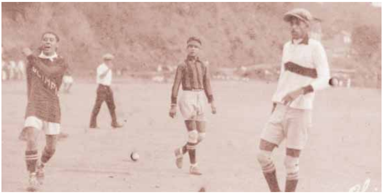
1928. 28 de abril. Fotografía tomada por "Chencho" Valladares del juego en La Isla entre Olimpia y "Tejeros" del España.