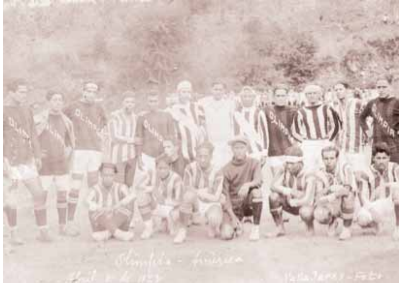
1928. 8 de abril. Olimpia se enfrenta a América en La Isla.