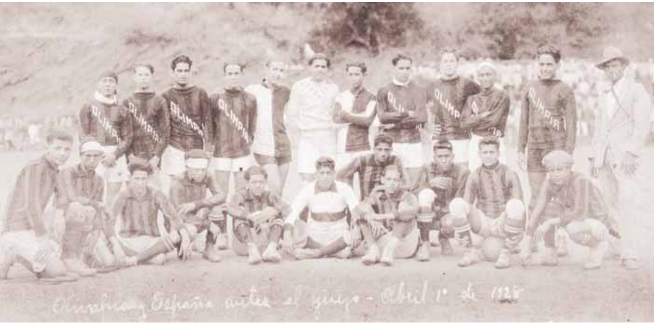
1928. 1 de abril. En la legendaria cancha La Isla se enfrentan Olimpia y los "Tejeros" del España. En ese entonces, el uniforme del León era de color negro.